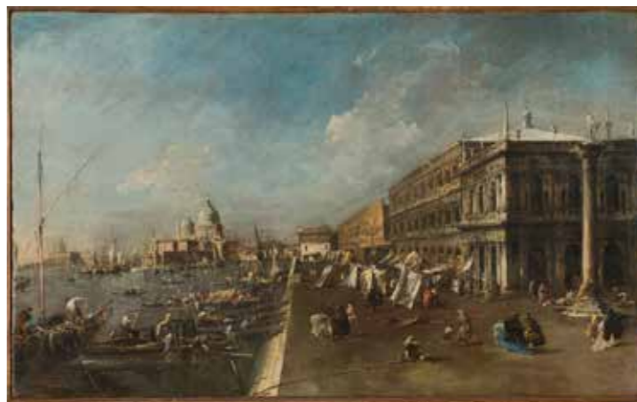
Francesco Guardi (1712 - 1793) Vista del molo . Venezia, Galleria Giorgio Franchetti, alla Ca' d'Oro.