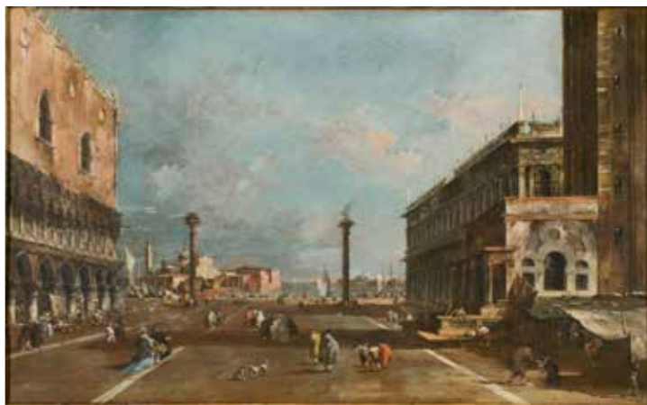
Francesco Guardi (1712 - 1793) Veduta della piazzetta verso S. Giorgio . Venezia, Galleria Giorgio Franchetti, alla Ca' d'Oro.

A culture has developed around it, and in turn coffee has developed thanks to this culture; these phenomena have merged to become one. In today's Italian culture the "Espresso Coffee" is synonymous with Italy and Italy is the homeland of coffee.